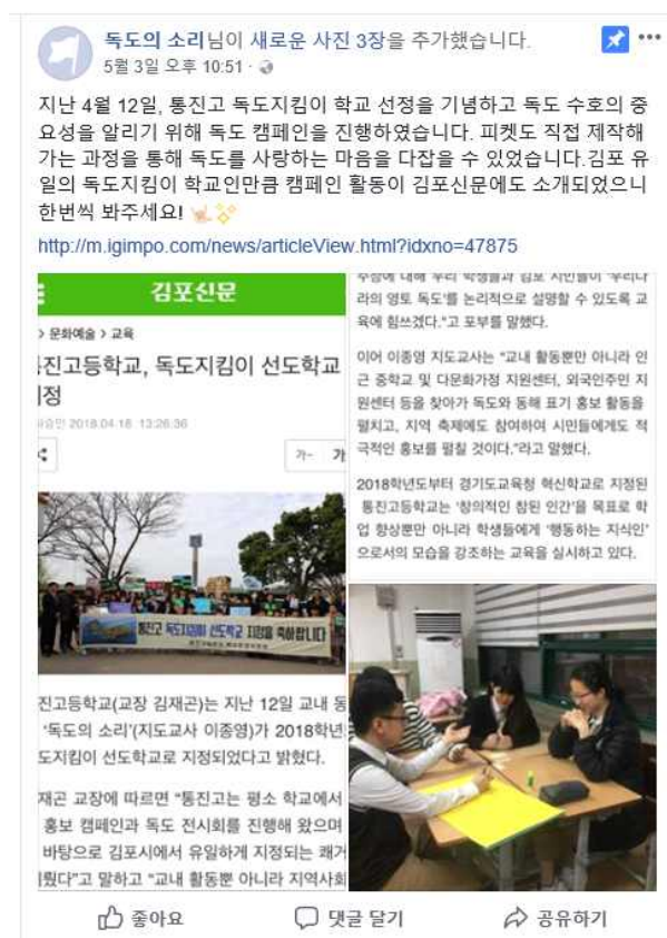
< 독도의 메아리 페이지 >