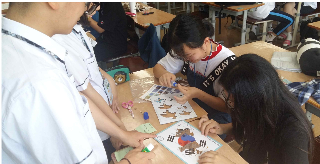
<독도 등고선 만들기>