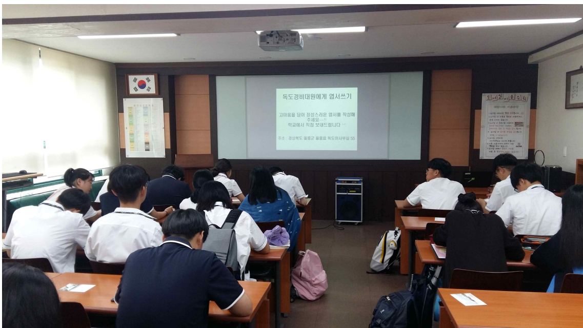
< 엽서 쓰기 >