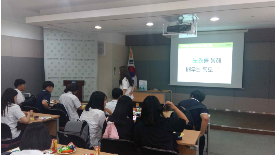
< 노래를 통해 배우는 독도 >

독도체험관을 방문하여 노래를 통해 배우는 올바른 독도 프로그램을 참여함. ‘독도는 우리 땅’의 노래가사를 이용하여 독도에 대해 잘못 지어진 가사 내용을 개사하고, 올바른 정보를 가진 노랫말을 다시 만들어 노래를 불러보는 프로그램을 참여하였음. 노래를 통한 독도 홍보를 기획하여 인근 중학교랑 연계할 계획임.