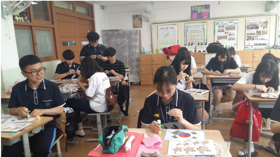
< 모형 만들기 >

독도 등고선 모형을 직접 제작하여 전시하였음. 독도 모형을 제작함으로써 독도가 가진 실제 모습을 간접적으로 체험할 수 있었음. 본교 중앙 현관에 전시를 함으로서 본교 학생들이 독도의 실제 모습에 대해 관심을 가지는 계기가 되었음.