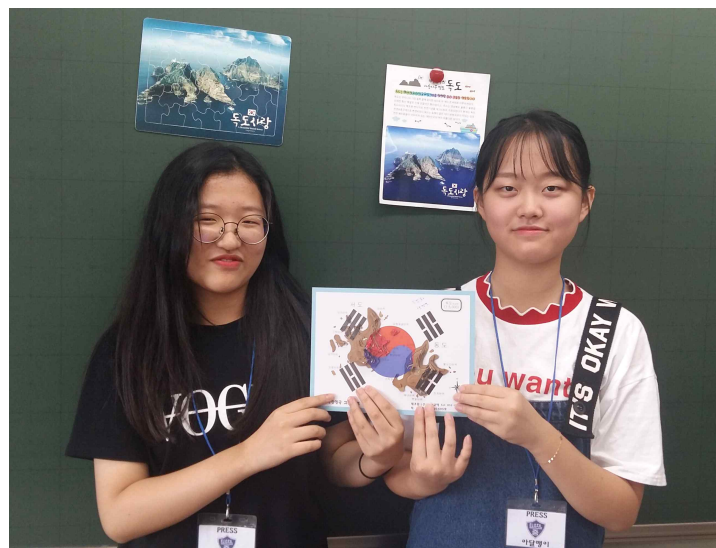
<독도 등고선 모형 완성>