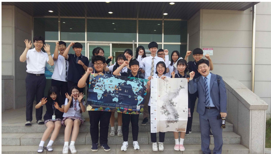
< 반크 박기태 단장님과 함께 >

우리나라 홍보전문가인 반크 박기태 단장님을 모시고 ‘독도가 소중한 이유, 동해 표기의 정당성’ 등에 대하여 본교 교직원, 학부모, 학생들과 함께 강연을 진행하였음. 본교 나루관 다목적실에서 약 100여명의 참여하여 2시간 동안 독도에 대해 생각할 수 있는 기회가 되었음. 본 프로그램은 김포 신문에 기사로 제작되어 배부될 정도로 뜻깊은 강연이었음.