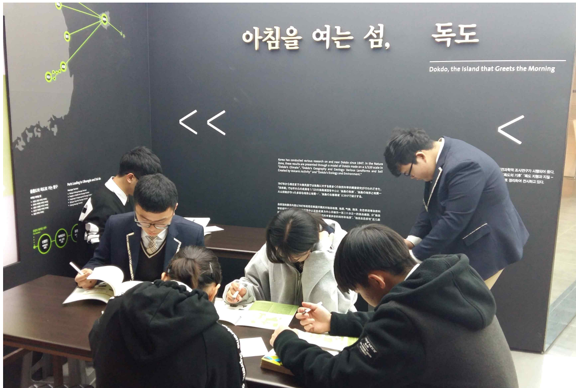
<독도 학습지 풀이>

독도 동아리로서 독도에 대한 정확한 정보를 얻고, 독도전문가로서 교육을 위해 서울에 위치한 독도체험관을 견학하여 관련 활동을 펼쳤음.