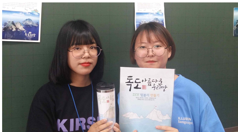
<독도 텀블러 만들기 완성>