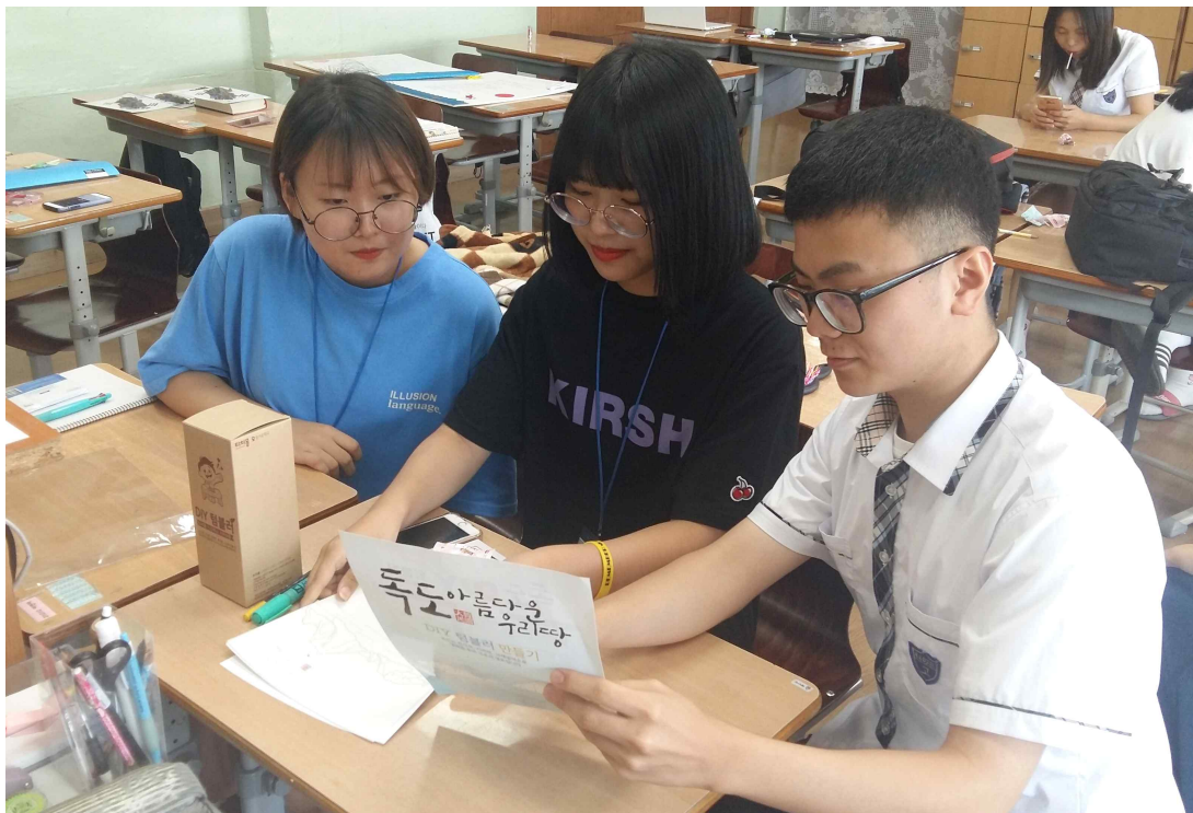
<독도 텀블러 만들기>