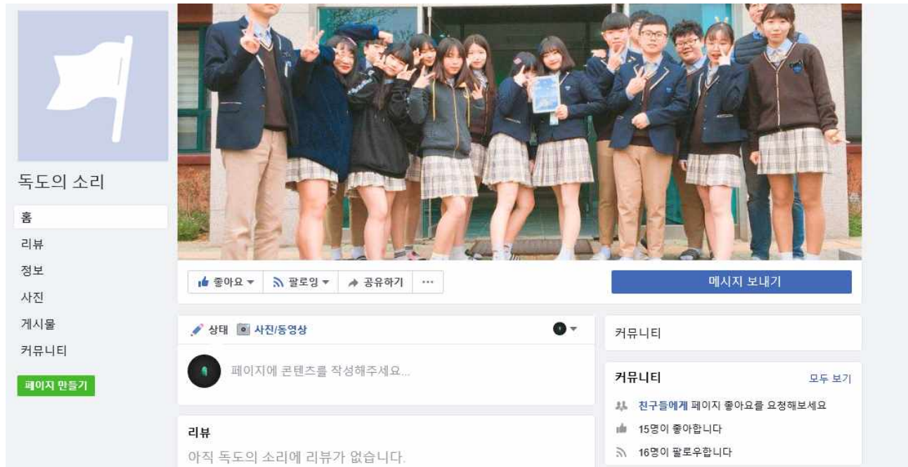
< 공식 SNS 페이스북 >

공식 SNS를 개설하였음. 동아리 활동사진과 더불어 나루제체육대회에서 준비한 ‘독도는 우리 땅’ 플래시몹 동영상을 탑재하여 본교 학생들에게 홍보함. 1년 동안 지속적으로 독도 홍보 활동을 온라인상으로 펼칠 예정임.