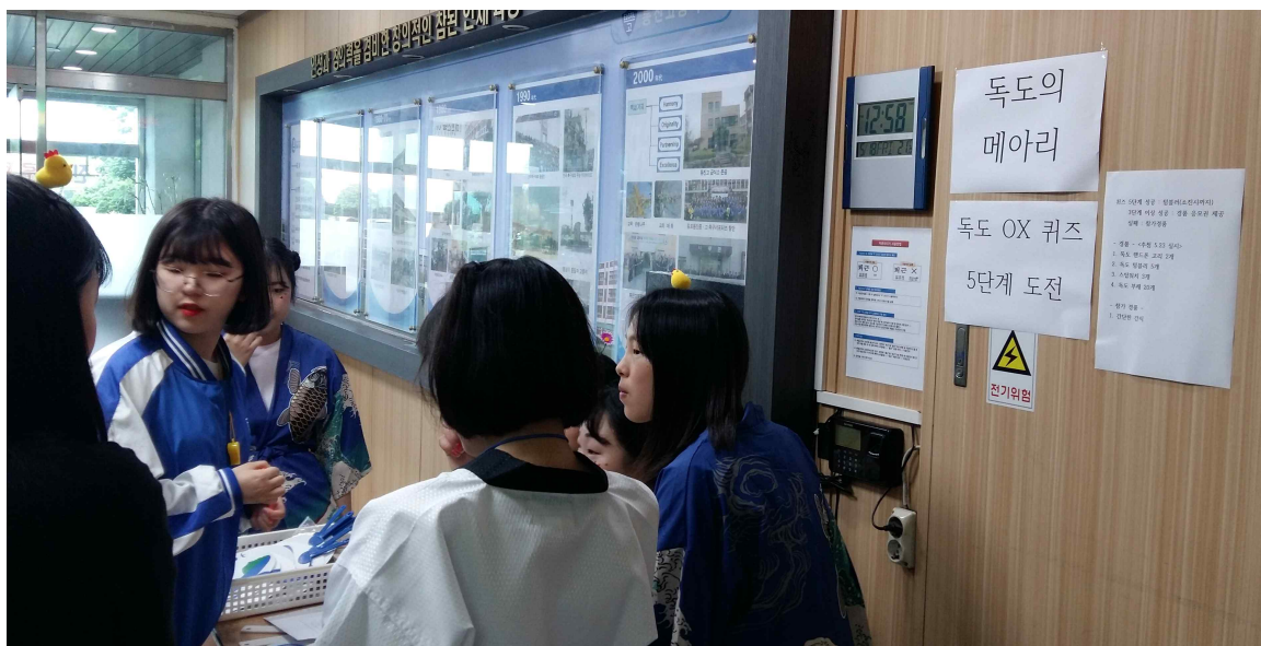
<독도 OX 퀴즈>