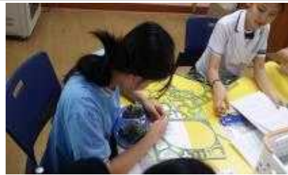
조금만 더 힘내면 완성이야~