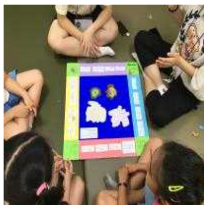
독도 마블로 독도에 대한 흥미와 관심이 동시에 업~UP