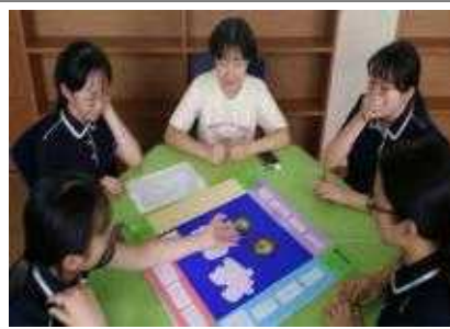
다 같이 옹기종기 모여서 독도마블 START ~