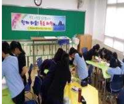
1학년 학생들이 체험하는 모습