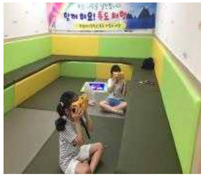
순식간에 우리 바다 동해로 풍덩! 해 볼까요?