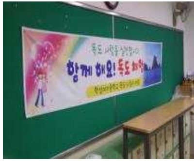
독도 동아리실 설치된 '함께해요! 독도체험' 현수막