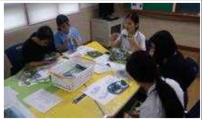
자 ~ 다들 만들어 보아요