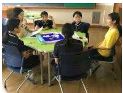
독도 퀴즈~ 어렵다면! 고민하지마! 엉덩이로 ‘독도’ 써!