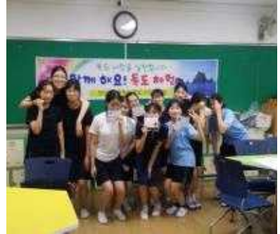
독도 놀이를 즐기고 기념사진