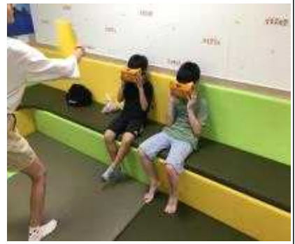
독도의 위치과 모양을 독도 VR로 알 수 있어요