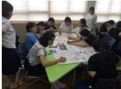
독도 컬러링을 즐기며 독도의 경제적 가치를 알아가는 중!