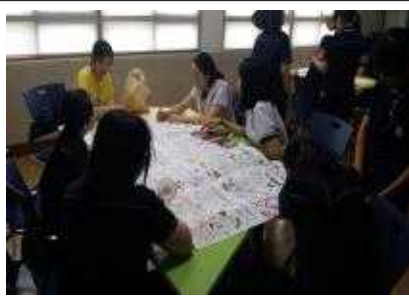
독도가 아름다운 색을 찾았어요.