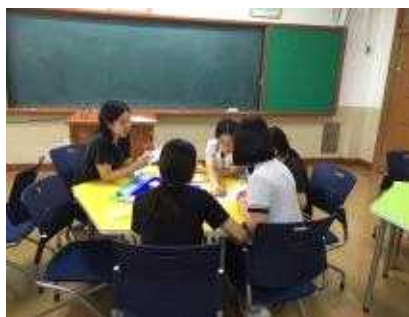
독도 마블을 즐기며 우리 땅 독도를 알아가는 친구들~