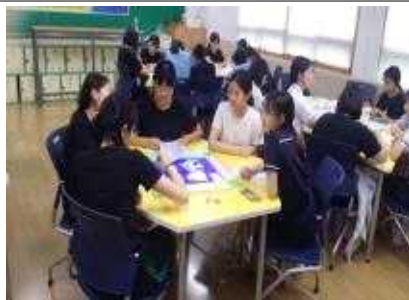
독도 퀴즈~ 정답 맞추고 다음 칸으로 이동~♥ 독도의 자연환경은 독도 마블 게임과 함께 재밌게 이해해요