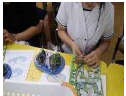
완성 직전의 독도입체모형