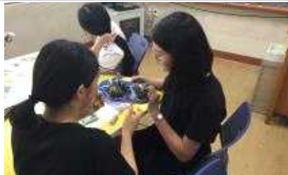
드디어 완성! 독도 입체 퍼즐