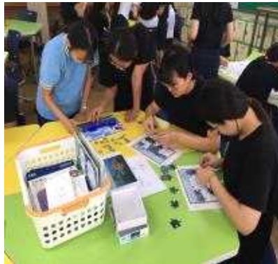
가장 먼저 퍼즐을 맞추기 위해 집중! 또 집중 합시다~