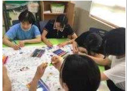
경제적 가치가 큰 독도를 아름답게~ 컬러링 해봐요★