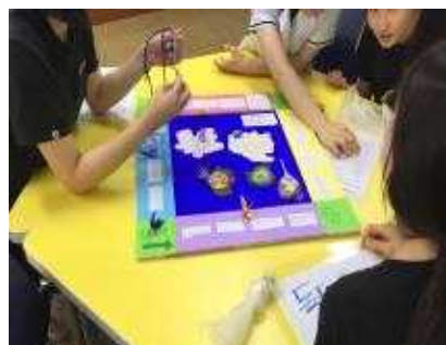
우승자에게 사탕을! 당신은 독도 전문가!