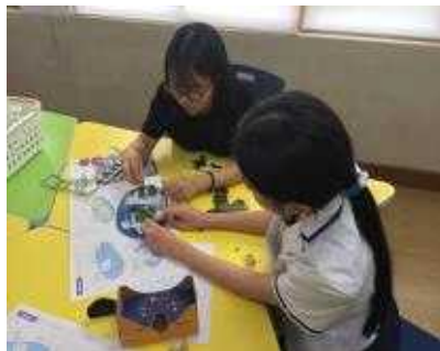
2명이 힘을 합쳐 독도 입체 모형 완성 중~~