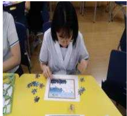
퍼즐이 잘 맞춰지지 않아 실망하고 있지만~ 화이팅!