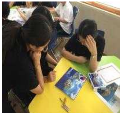
독도 직소 퍼즐 놀이 중 고뇌하고 있어요 ~