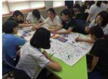
여기 부분 색칠은 “내가!”