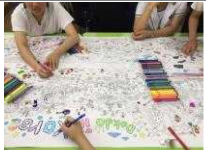
곱게 단장중인 우리 땅 독도