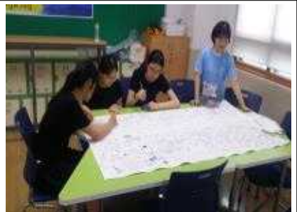
독도 바다는 황금어장이라지요~!