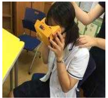
독도VR에 심취해 독도의 육상과 해상 360도 영상 시청 중~♪ 독도의 위치와 모양은 독도 VR과 함께라면 알기 쉬워요~