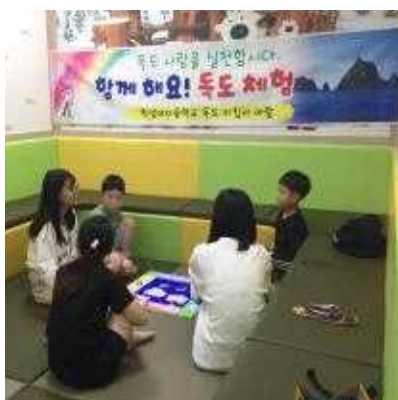
재밌는 독도 마블~ 이제 시작해 볼까요?!