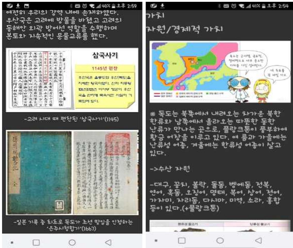
사진4>독도앱 일부분 캡처 이미지