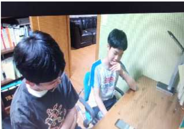
사진1>다른 친구들과 함께 독도앱을 시행 해본 사진

이를 위한 첫발걸음으로 앱을 만든 후 학교친구들 폰에 설치하여 퀴즈등을 통해 반응을 보았고 지식만 들어있던 종전의 독도 앱과 달리 독도에 관한 관심을 높일 수 있었다. 우리의 독도 앱을 통해 기존의 인쇄물로 알리던 방식보다 좀 더 빠르고 쉽게 전 세계인들에게 독도가 우리나라 땅임을 알릴 수 있을 것 같다