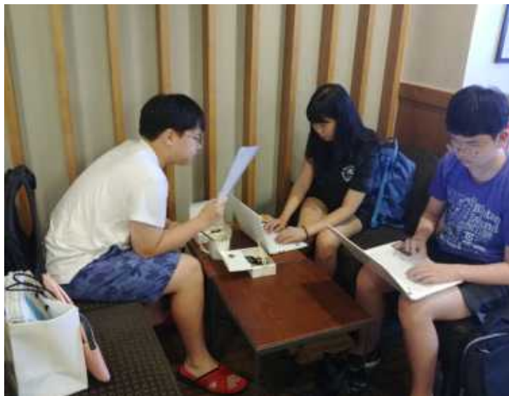
사진5>독도 앱만들기 활동 사진