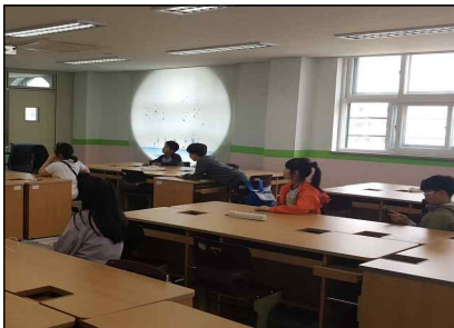
독도의용수비대기념사업회초청 독도 역사 수업