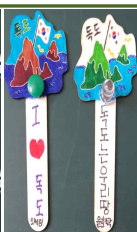
【홍보 자료 제작과 전시로 독도사랑 홍보】