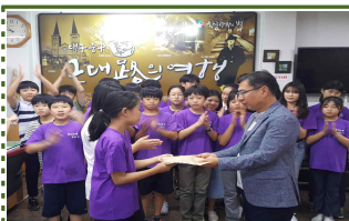
【중구 삼덕동 주민센터 방문 기부금 전달】