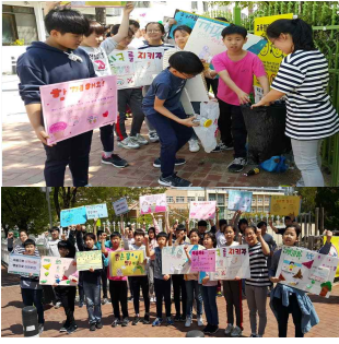
【독도 홍보 캠페인 활동】