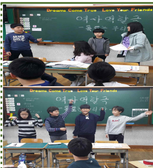
【독도 역사 역할극 발표회】