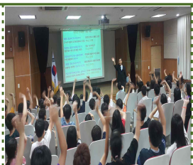
【강사 초청 독도교육】