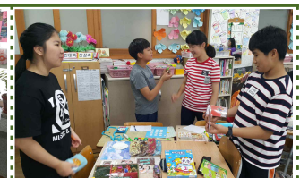
【독도 홍보 아나바다 알뜰시장 활동】