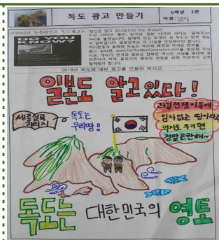
【독도 광고 만들기】