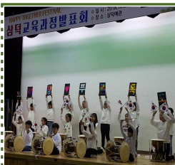
【독도 홍보 공연】