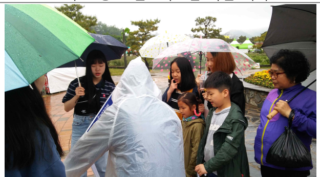
* 축제 참가 일반인 대상 홍보 활동