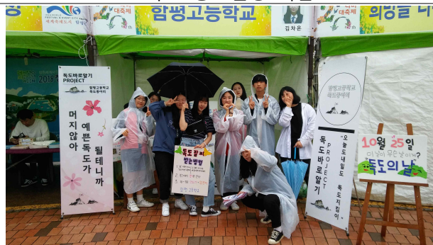
* 홍보활동 오전 참가학생