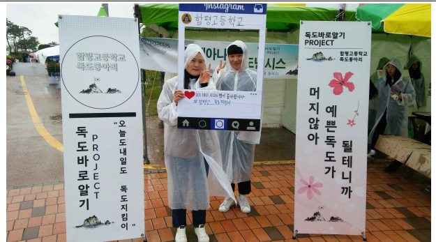
* 독도 홍보 인스타그램 사진 찍기