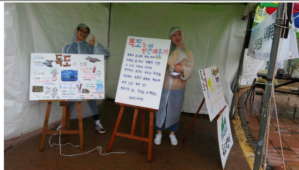
* 독도 홍보활동 작품