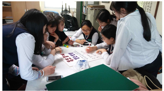
* 홍보 활동 작품 제작 과정