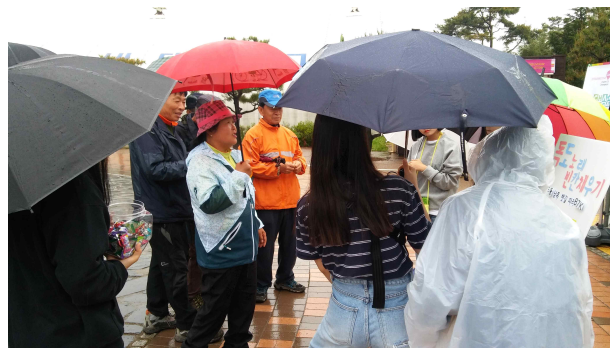
* 축제 참가 일반인 대상 홍보 활동