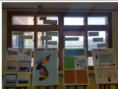
▲독도 역사 신문