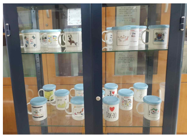
▲독도 시티컵 디자인