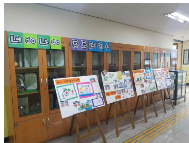
▲독도 시티컵 디자인