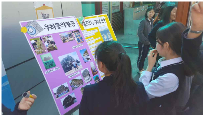
자료 2. 독도 홍보 및 독도지킴이학교 활동