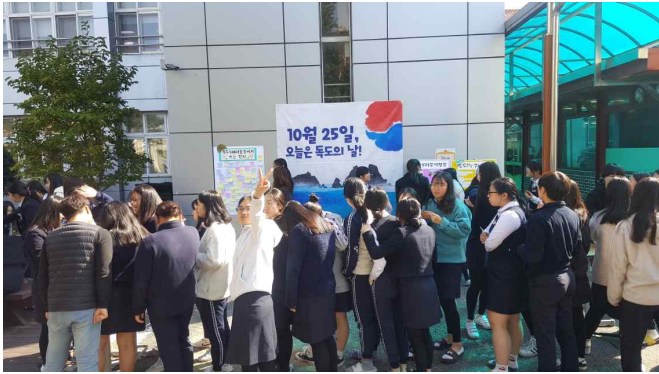
자료 1. 독도의 날 전경