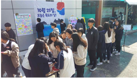
자료4. 독도 퀴즈