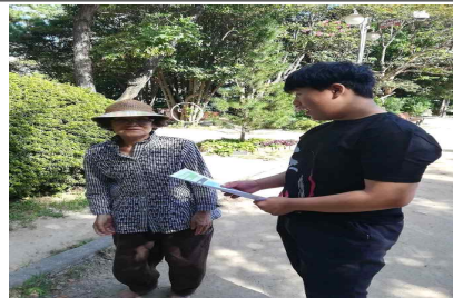
< 캠페인 활동 진행 > 독도 홍보 활동