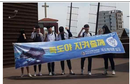
< 캠페인 활동 진행 > 활동 종료 후 단체 사진 촬영