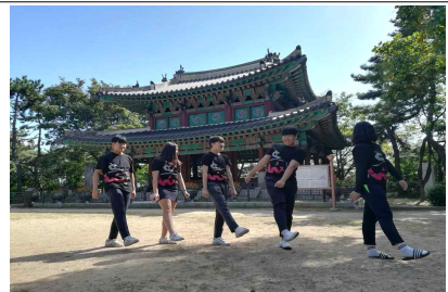
< 캠페인 활동 진행 > 플래시 몹 공연