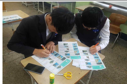
< 캠페인 활동 준비 과정 > 독도 홍보 팸플릿 제작