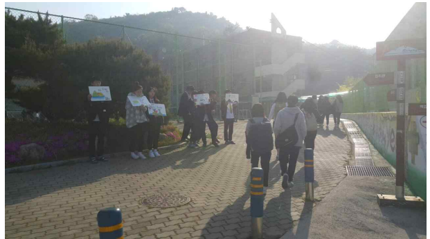
● 독도의 날 기념 캠페인 활동 정문과 학교 운동장 주변