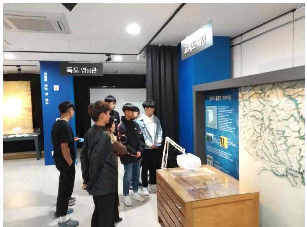
● 광주광역시 학생독립운동기념관 지하1층에 위치하고 있는 독도체험관 탐방