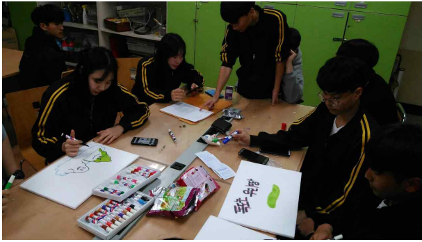
● 독도의 날 기념 캠페인 활동 준비