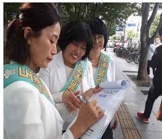
“독도란” 홍보 캠페인