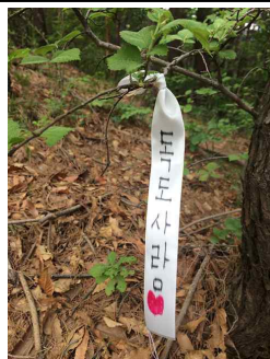
독도사랑 등산로 표식