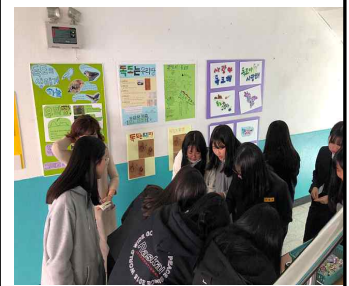
10.25. 독도의 날 학교 캠페인