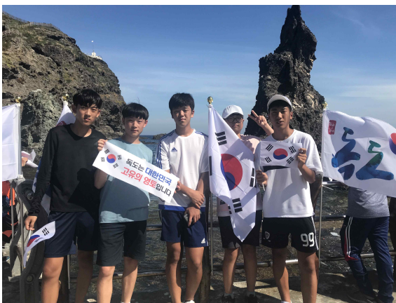
△ 독도에서의 단체 사진