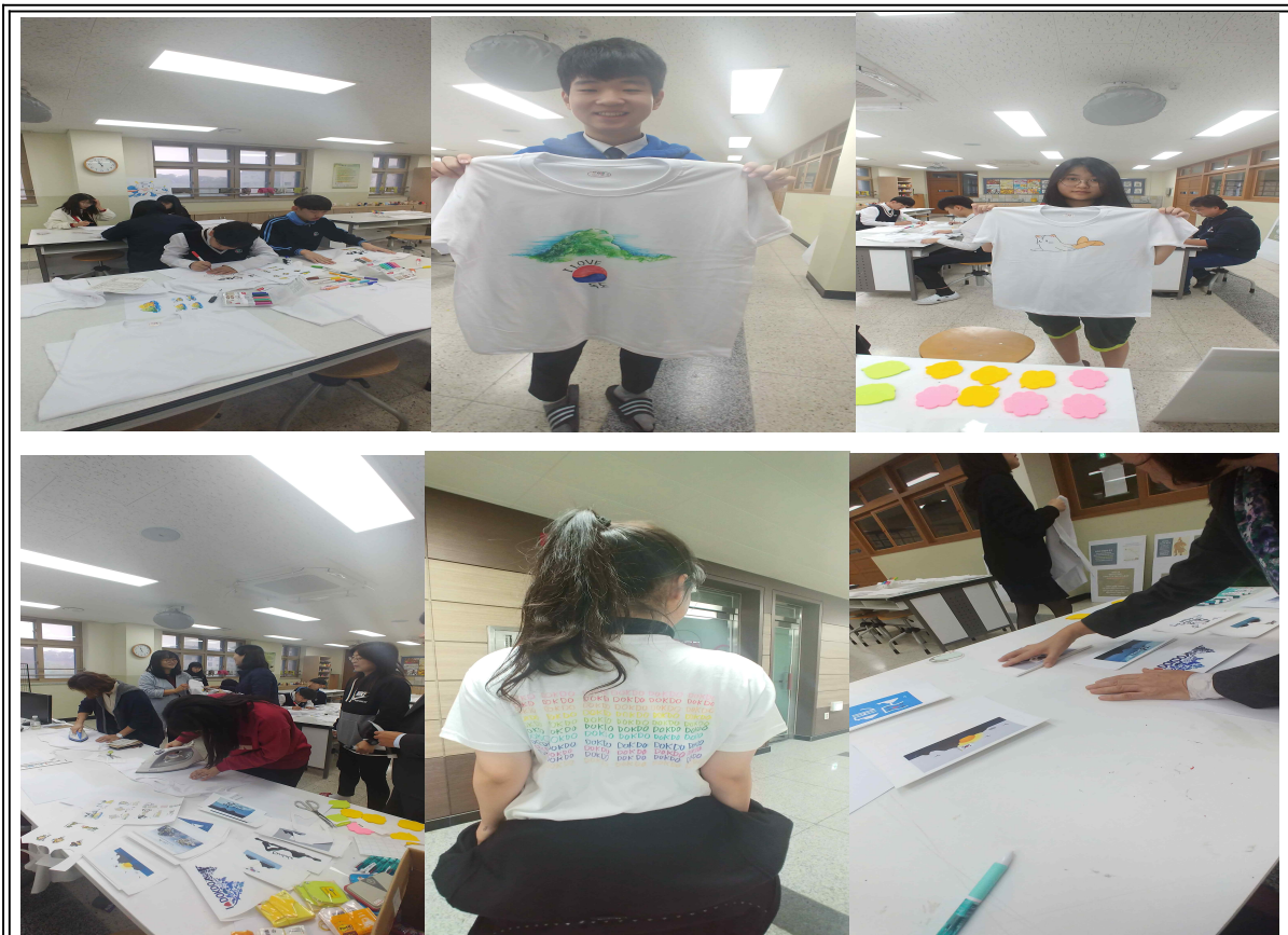
[그림-1] 독도 캐릭터 제작