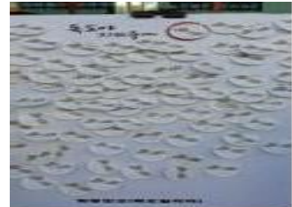
독도 사랑 메시지