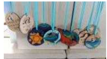
독도 생물종 우드아트