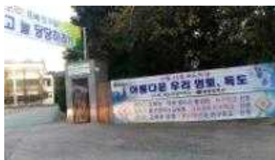
독도의 날 현수막 게시