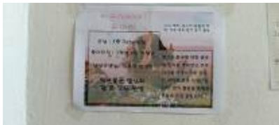
독도 알리미 동아리원 모집 포스터

3학년 학생들이 동아리 공모전(2017.12.)에 제안하고 홍보포스터를 제작하여 전교생을 대상으로 홍보 활동(2018.3.)하여 독도에 관심이 많은 학생들을 중심으로 독도알리미 동아리를 구성. 2주에 한 번 2시간씩 독도 자료 조사 및 홍보물 제작, 독도 신문 제작, 독도 관련 행사 준비를 함. '독도 알리미 리더'로서 독도 바르게 알기의 모든 활동(2018.3.~2018.10.)을 주도적으로 운영.