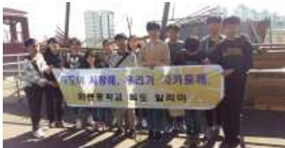
부산 안용복 기념관 견학

3학년 학생들이 동아리 공모전(2017.12.)에 제안하고 홍보포스터를 제작하여 전교생을 대상으로 홍보 활동(2018.3.)하여 독도에 관심이 많은 학생들을 중심으로 독도알리미 동아리를 구성. 2주에 한 번 2시간씩 독도 자료 조사 및 홍보물 제작, 독도 신문 제작, 독도 관련 행사 준비를 함. '독도 알리미 리더'로서 독도 바르게 알기의 모든 활동(2018.3.~2018.10.)을 주도적으로 운영.