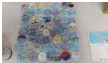
독도 사랑 뱃지 만들기