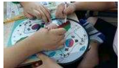
독도 부채 만들기