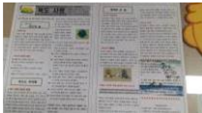
독도 신문 배부