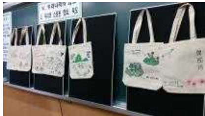
3학년 독도 인포그래픽 굿즈(에코백)