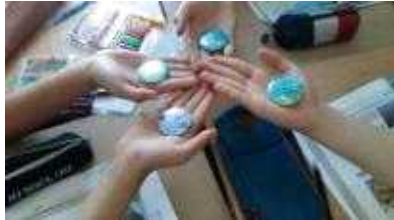
1학년 독도 바르게 알기

교육과정과 연계하여 독도 관련 단원이 있는 학년 전 학생들을 대상으로 독도에 대해 바르게 알고 독도를 사랑하는 마음을 내면화 할 수 있는 활동 중심 수업을 운영하고 그 결과물을 전시하고 공유함.