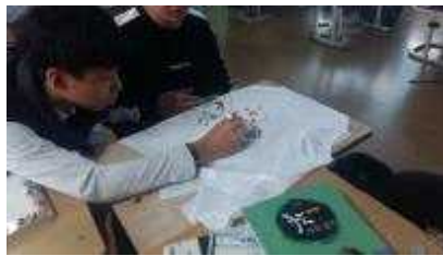
독도 인포그래픽 굿즈(티셔츠)