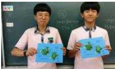
독도 지형도 입체모형 제작