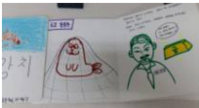
동화책으로 만든 강치 이야기