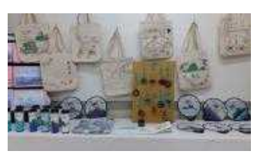
독도 알리미 산출물 전시관