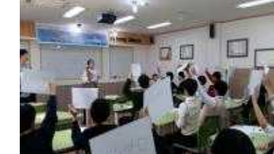
독도 사랑 골든벨