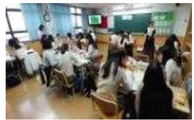
울산시 '수업 콘서트' 독도 수업