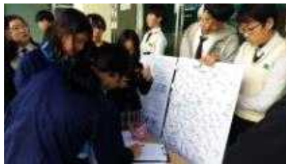
독도 사랑 메시지 남기기