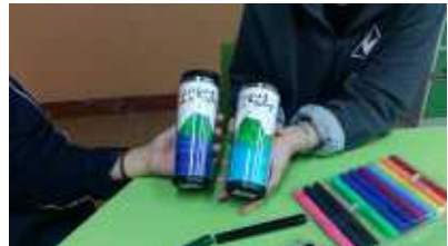
독도 사랑 텀블러 제작