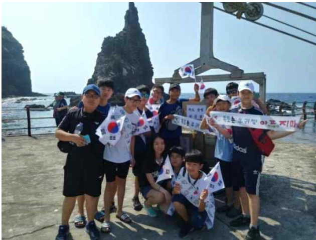
▲ 독도 수호 결의 활동