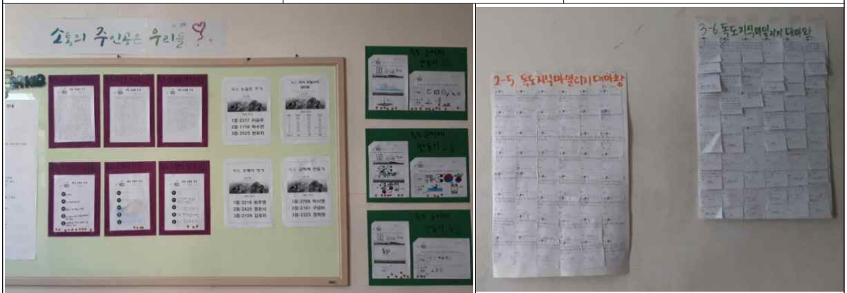
교내 복도 및 소통 공간에 게시하여 결과물 공유