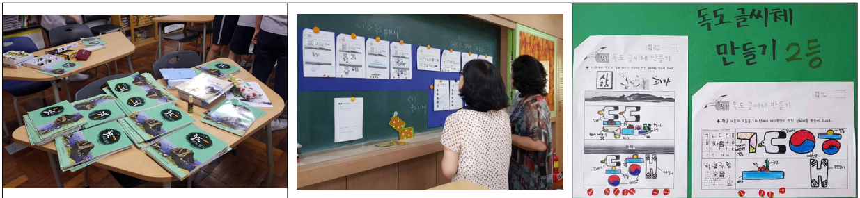
학생들의 철저한 행사 준비