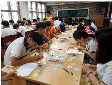
< 핀버튼 제작 >