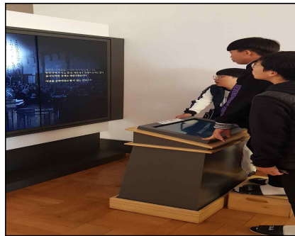
▶ 진중하게 증명전을 관람하는 학생들

체험학습을 마친 뒤에는 후속 활동으로 체험에 참여하지 못한 다른 동아리원에게 체험관 팸플릿을 나눠주고 학생들이 직접 촬영한 사진을 보여주며 소감을 나누는 시간을 마련하였다. 체험학습에 참여한 학생들은 다시 한 번 그 날의 감상을 떠올리며 친구들에게 열정적으로 관람 후기를 전했다.