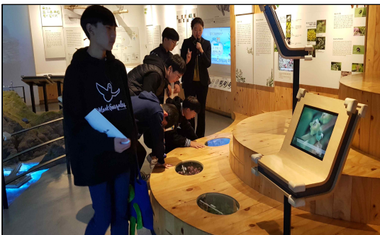
▶ 자연관에서 설명을 경청하는 학생들

학생들은 해설사 선생님의 전문적인 설명을 경청하며 전시물을 관람하였다. 일부 학생은 팸플릿에 설명 내용을 열심히 옮겨 적기도 하였다. 전시관은 자연관과 역사관으로 나누어져 있어 학생들의 체계적인 독도 이해를 도왔다. 자연관에서는 독도와 주변 환경을 그대로 옮겨놓은 듯한 커다란 모형이 학생들의 관심을 끌었으며, 역사관에는 독도가 우리 영토임을 증명하는 다양한 고지도와 문헌들이 관람객의 호기심을 자극할 수 있는 방법으로 전시되어 있었다. 학생들은 직접 지도를 꺼내보고, 안내 버튼을 클릭해가며 적극적으로 전시관을 둘러보았다.