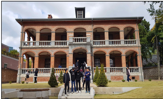
▶ 증명전 앞에서

독도체험관에서 나온 후에는 도보 거리의 덕수궁에 들러 역사 탐방을 겸하기로 하였다. 한국 근현대사의 아픔이 서려있는 공간이기도 한 덕수궁에서 학생들에게 대한제국부터 일제의 국권 침탈까지의 개략적인 상황을 설명했다. 특히 실제 을사조약이 체결된 장소였던 증명전에서 학생들은 가장 많은 질문을 하였다. 독도체험관에서 일본의 독도 강탈 과정을 학습하고 온 학생들이기에 관람 태도도 한층 숙연해졌다. 생생한 역사의 현장에서 다시 한 번 주권의 소중함을 깨닫는 순간이었다.