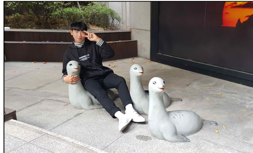
▶ 체험관 입구의 강치가 반가운 학생

학생들은 해설사 선생님의 전문적인 설명을 경청하며 전시물을 관람하였다. 일부 학생은 팸플릿에 설명 내용을 열심히 옮겨 적기도 하였다. 전시관은 자연관과 역사관으로 나누어져 있어 학생들의 체계적인 독도 이해를 도왔다. 자연관에서는 독도와 주변 환경을 그대로 옮겨놓은 듯한 커다란 모형이 학생들의 관심을 끌었으며, 역사관에는 독도가 우리 영토임을 증명하는 다양한 고지도와 문헌들이 관람객의 호기심을 자극할 수 있는 방법으로 전시되어 있었다. 학생들은 직접 지도를 꺼내보고, 안내 버튼을 클릭해가며 적극적으로 전시관을 둘러보았다.