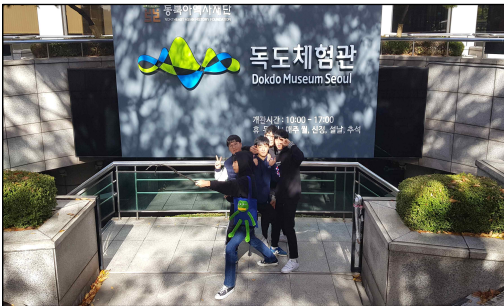
▶ 독도체험관 입구에서

오전 10시 30분경 도착한 독도체험관에서 학생들을 가장 먼저 반긴 것은 강치 모형이었다. 이미 독도의 생태에 대해 학습한 바 있는 학생들은 오늘날 멸종된 강치의 모습에 반가워하며 사진을 남겼다. 이어 체험관 안으로 이동하여 먼저 1시간여 동안 전시해설을 경청한 뒤 자유 관람을 진행하였다.