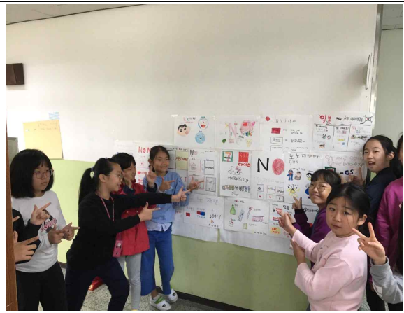
<일본 브랜드 불매운동 캠페인>