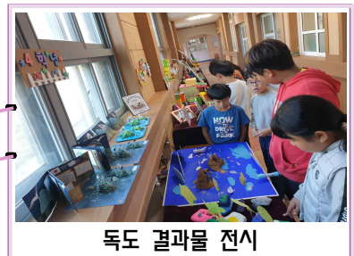
독도 결과물 전시