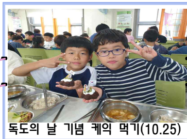
독도의 날 기념 케익 먹기(10.25)