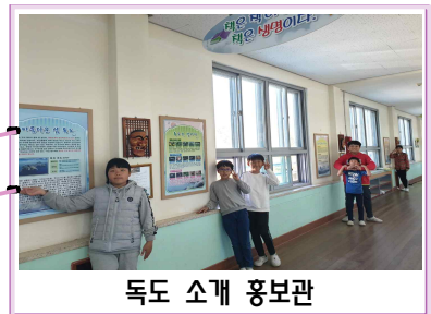
독도 소개 홍보관