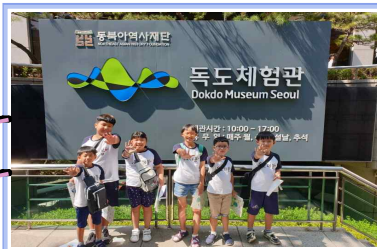
독도 체험관 견학(8.22.)