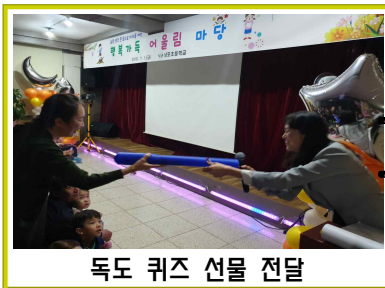
독도 퀴즈 선물 전달