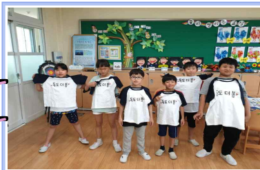
독도 더 봄 티 제작