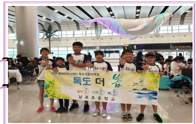
제주공항 독도사랑 홍보 캠페인