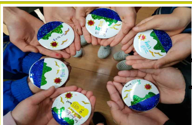
나만의 독도사랑 뱃지 만들기