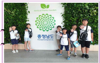
충남도청과 도서관에서 독도 홍보