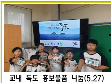
교내 독도 홍보물품 나눔(5.27)