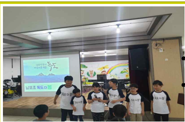
독도 더 봄 프로젝트 발표