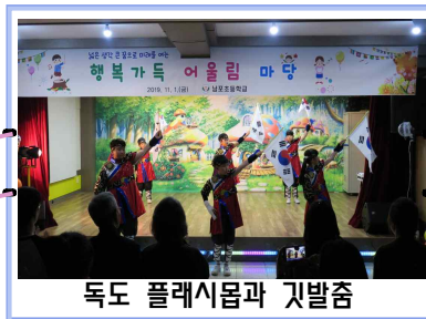
독도 플래시몹과 깃발춤