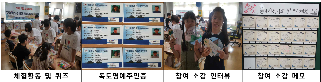
체험활동 및 퀴즈