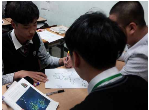
그림 4 홍보물 만들기