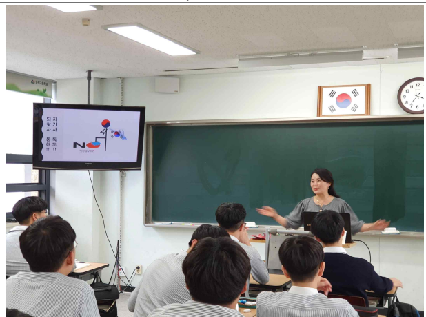
그림 6 독도 및 동해 이해 교육