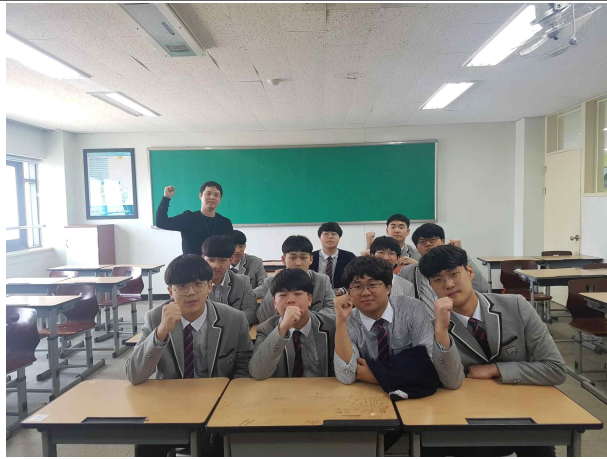
그림 1 독도 사랑 캠페인 활동 다짐