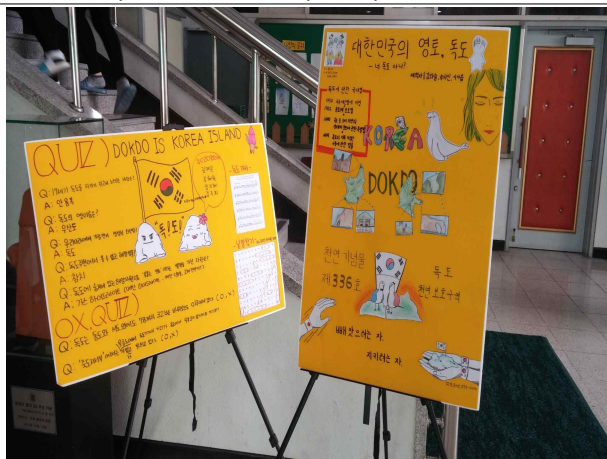
그림 5 독도는 우리 땅 홍보