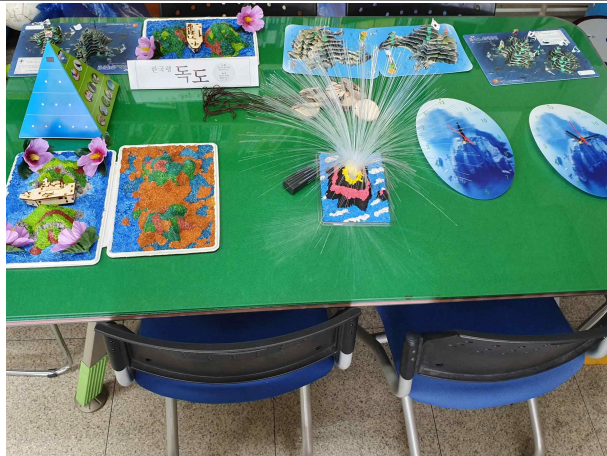
그림 3 독도 모형 만들기 전시