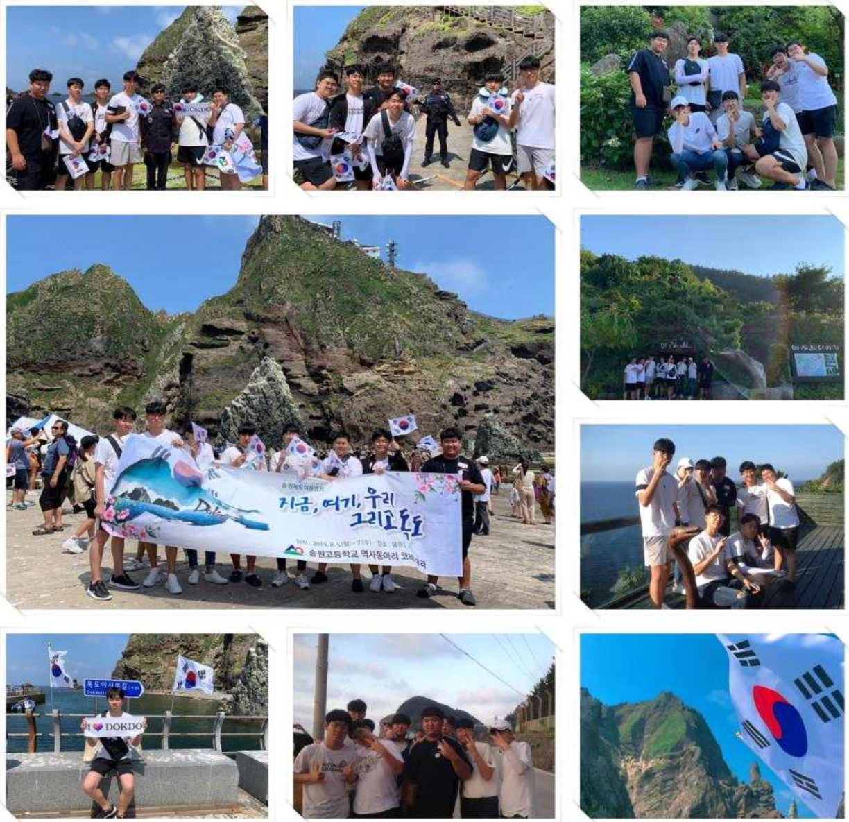
그림 7 독도 탐방 지원

* 각 활동 중 지도교사가 특히 잘되었다고 판단한 활동에 대해 상세 기술 분량은 관련 자료(사진 등)를 포함하여 A4 용지 2매 이내로 작성