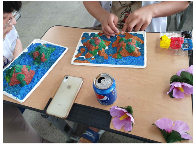
그림 2 독도 모형 만들기