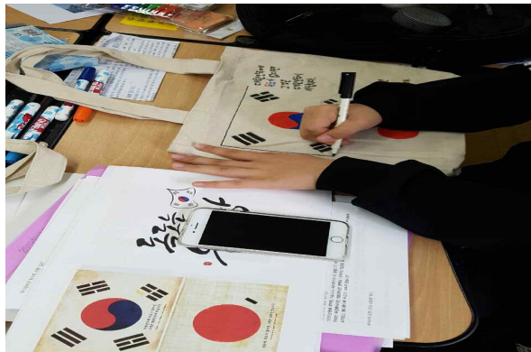
학생활동-에코백 독도 홍보 캐릭터 그리기