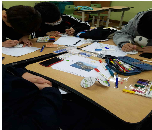
학생활동-독도캐릭터 패브릭거울 만들기