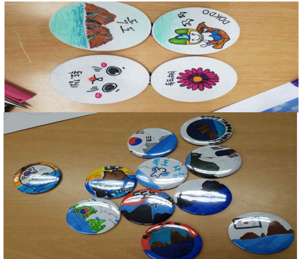
학생작품-독도캐릭터 패브릭거울과 프레스거울