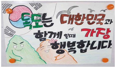
독도 포스터 그리기