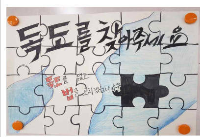
독도 포스터 그리기