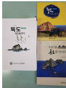
독도 체험활동 자료