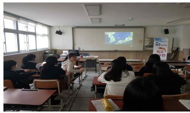
고문헌 고지도 파헤치기