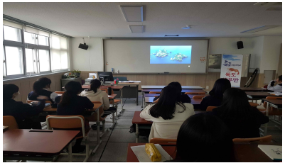
독도 계기 교육