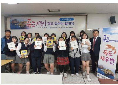
독도 새우반 발대식