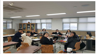
독도 십자 퍼즐 풀기