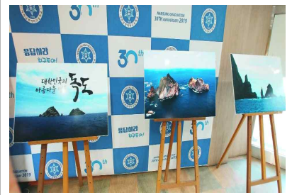
독도 사진 전시회