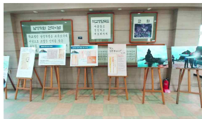
독도 사진 전시회