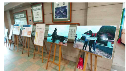
독도 사진 전시회