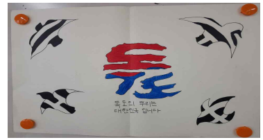
독도 포스터 그리기