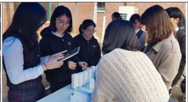
[ 독도 라인을 소개하고 있는 판매부 ]