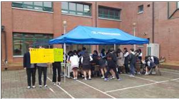
[ 독도 체험 부스 운영 ]

10월 25일 독도의 날, 전남외국어고등학교 전교생을 대상으로 VANK 동아리와 IUS 史 동아리 부원들이 함께 '독도 프로젝트' 체험 부스를 운영했다.