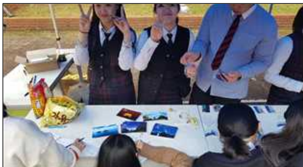
[ 독도 서명운동 진행 중인 참여부 ]