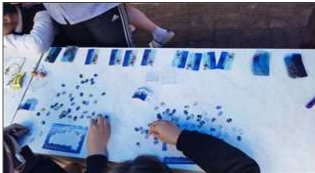
[ 독도 퍼즐 맞추기 진행 중인 학생 ]