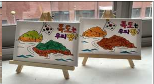
[ 독도 페인팅 칠하기 ]