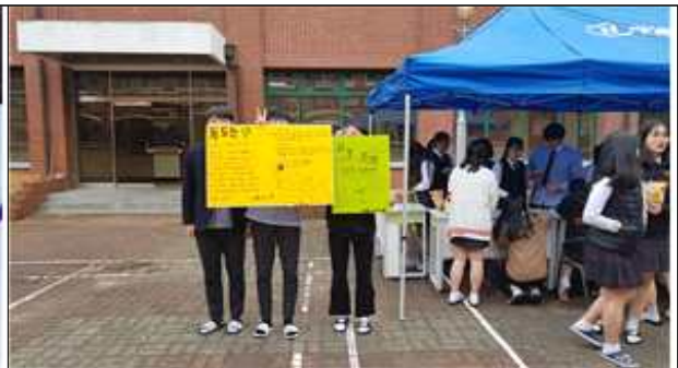
[ 독도를 홍보하고 있는 홍보부 ]