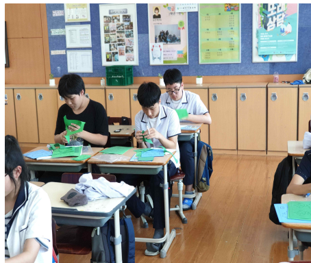
<독도 정밀 입체모형지도 만들기를 하고 있는 모습>