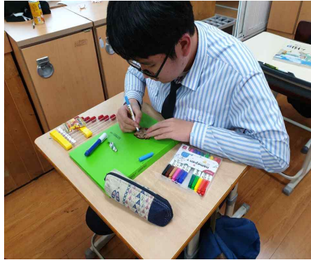
<우드아트 독도 멸종위기 동물 만들기를 하고 있는 모습>